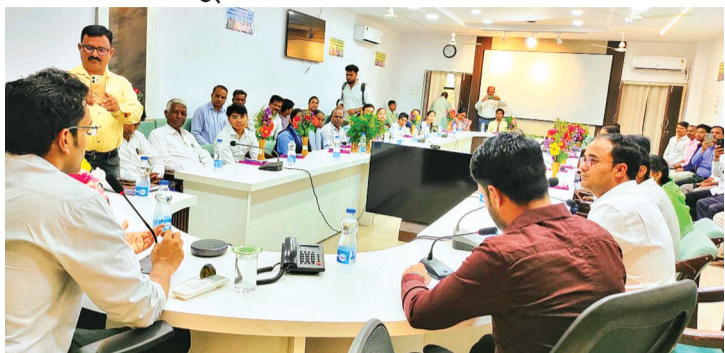
हरिभूमि न्यूज | हरदा

प्रावीण्य सूची में अक्वल स्थान पाने वाले विद्यार्थियों को मिलेगा किंडल ई बुक रीडर