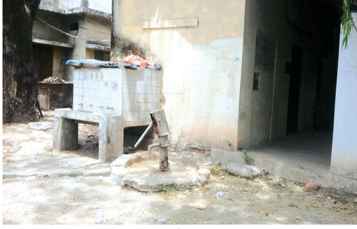
सोहागपुर। पुरानी तहसील कार्यालय में बंद पड़े हैडपंप एवं खराब पड़ी टंकी।

तहसील कार्यालय स्थित है। जिसमें एसडीएम कार्यालय संचालित होता है। यहां बनी पानी की टंकी वर्षों से खराब हालत में है। वहीं गर्मी के इस मौसम में तहसील कार्यालय आने वाले पक्षकारों एवं अन्य लोगों को पीने के पानी के लिए परेशान होना पड़ रहा है। नागरिकों ने प्रशासन से व्यवस्था बनाने की मांग की है।