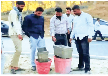
हरिभूमि न्यूज ▶▶ बैतूल

जिले में भीषण गर्मी के कारण जंगलों में जलस्रोत सूखने लगे हैं, जिससे वन्यजीवों के सामने पेयजल का गंभीर संकट खड़ा हो गया है। सारणी स्टेट हाईवे से लगे आमडोल और बरेठा घाट जैसे क्षेत्रों में हजारों की संख्या में बंदर, पक्षी और अन्य जंगली जीव पानी के लिए भटक रहे हैं। इस स्थिति को देखते हुए राष्ट्रीय हिंदू सेना के कार्यकर्ताओं ने वन्यजीवों के लिए पानी की व्यवस्था शुरू की है। संगठन के सदस्य जंगल और सड़क किनारे विभिन्न स्थानों पर पानी से भरे मटके रख रहे हैं। इसके अतिरिक्त, आमडोल और बरेठा घाट क्षेत्र में लगभग पांच स्थानों पर टांकों का निर्माण भी किया जा रहा है। इन टांकों में नियमित रूप से पानी भरा जा रहा है, ताकि भीषण गर्मी में वन्यजीवों को राहत मिल सके। कार्यकर्ता राहगीरों से भी इन घड़ों में पानी भरकर सहयोग करने की अपील कर रहे हैं। इधर, वन विभाग भी अपने स्तर पर वन्यजीवों के लिए पानी की व्यवस्था कर रहा है। चिचोली रेंजर शैलेंद्र चौरसिया के अनुसार, उनके क्षेत्र में 10 से 12 सासर (सीमेंट टैंक) बनाए गए हैं, जबकि पश्चिम वन मंडल में ऐसे 25 से 30 सासर मौजूद हैं। इन सासरों को टैंकों के माध्यम से भरा जाता है। हालांकि, विभाग फिलहाल अतिरिक्त बजट का इंतजार कर रहा है, जिससे व्यवस्था करने में बाधा आ रही है।