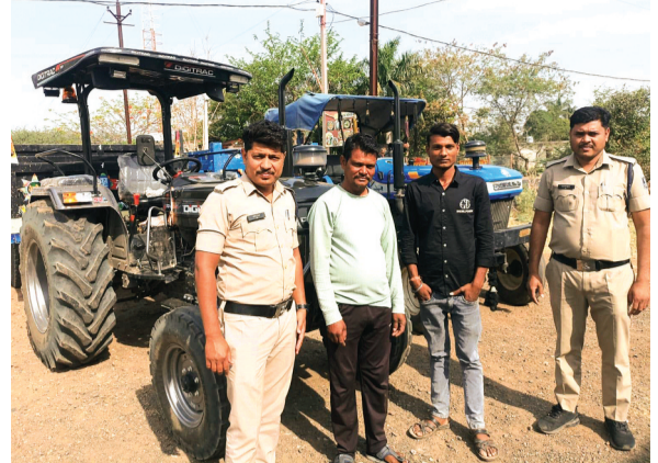
हरिभूमि न्यूज | हरदा