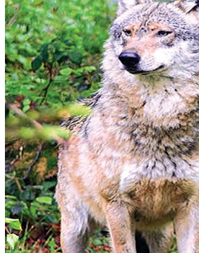
हरिभूमि न्यूज | झिरन्या

समीपवर्ती कालिकराय गांव में पिछले 15,20 दिन से तीन भेड़िए (लॉडिया) की एक टोली सक्रिय है, जिनमें दो वयस्क और एक शावक है। वे दो बकरे और एक बच्चे (पाट) का शिकार कर चुके हैं। उन्होंने एक अन्य स्थान पर भी ऐसा ही प्रयास किया, लेकिन उन्हें सफलता नहीं मिली है। वहीं, चिंतित पशु पालक पशु बाड़े के आसपास