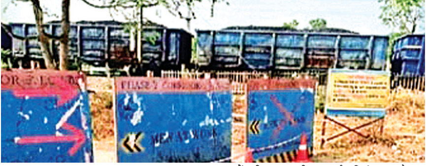
हरिभूमि न्यूज ▶▶ बैतूल

गंज रेलवे अंडरब्रिज से दो दिन बाद यानि 21 अप्रैल से आवागमन शुरू हो जायेगा। इस निर्णय से रामनगर, गर्ग कॉलोनी सहित आसपास के क्षेत्रों के नागरिकों खासकर स्कूली बच्चों को बड़ी राहत मिलने की उम्मीद है। संशोधित योजना के अनुसार 21 अप्रैल से गंज अंडरब्रिज से दोपहिया व चार पहिया हल्के यात्री वाहनों का आवागमन शुरू हो जाएगा। इससे लंबा फेरा लगाकर आवागमन करने को मजबूर वाहन चालकों को राहत मिलेगी और सदर के ओवरब्रिज पर बढ़ते ट्रैफिक दबाव में भी कमी आएगी। रेलवे अधिकारियों ने स्पष्ट किया कि तीसरी लाइन के निर्माण कार्य को समयबद्ध तरीके से पूर्ण करना आवश्यक तो है, परंतु साथ ही नागरिकों की सुविधा और दैनिक जीवन पर न्यूनतम प्रभाव सुनिश्चित करना भी हमारी प्राथमिकता है। दोनों के बीच संतुलन बनाते हुए यह संशोधित योजना तैयार की गई है। यहां उल्लेखनीय है कि तीसरी रेलवे लाइन और अंडरब्रिज की लंबाई बढ़ाने के कारण रेलवे ने गत 3 अप्रैल से 45 दिनों के लिए अंडरब्रिज से