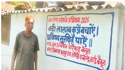
हरिभूमि न्यूज ▶▶ बैतूल

मुख्यमंत्री डॉ. मोहन यादव के नेतृत्व में पानी की प्रत्येक बूंद को सहेजने के लिए प्रदेश सरकार द्वारा जल गंगा संवर्धन अभियान चलाया जा रहा है। इसके अंतर्गत प्रदेश में बड़ी संख्या में खेत तालाब, अमृत सरोवर, रैन वॉटर हार्वेस्टिंग सिस्टम और सूखे कुंआं को नया जीवन देने का कार्य किया जा रहा है। साथ ही नागरिकों को जल संरक्षण के लिये प्रेरित करने हेतु विभिन्न जागरूकता गतिविधियों का आयोजन किया जा रहा है। इसी क्रम में मध्य प्रदेश जन अभियान परिषद जिला बैतूल द्वारा संचालित जल गंगा संवर्धन अभियान के अंतर्गत जल