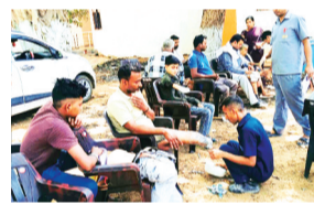
हरिभूमि न्यूज ▶▶ बैतूल